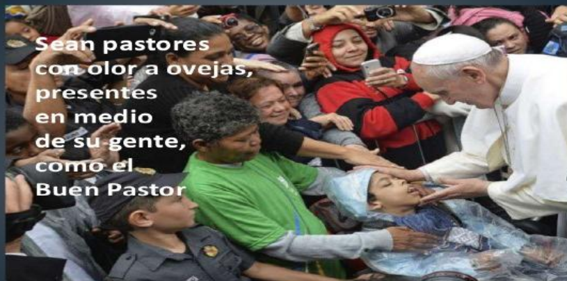
Papa Francisco, a obispos y sacerdotes en diversas oportunidades