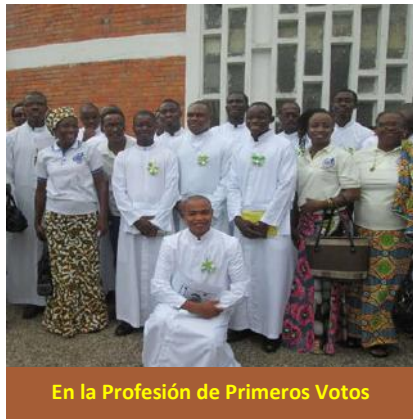
En la Profesión de Primeros Votos

En las parroquias de: Santa Margarita María, Santa Trinidad, San Agustín, San Lucas y San Carlos