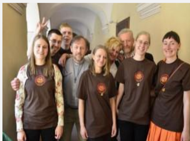
Voluntarios en Polonia

También estamos rezando para que más personas estén interesadas en apoyar nuestras actividades, especialmente en nuestras visitas a áreas rurales y pobres servidas por los Verbitas.